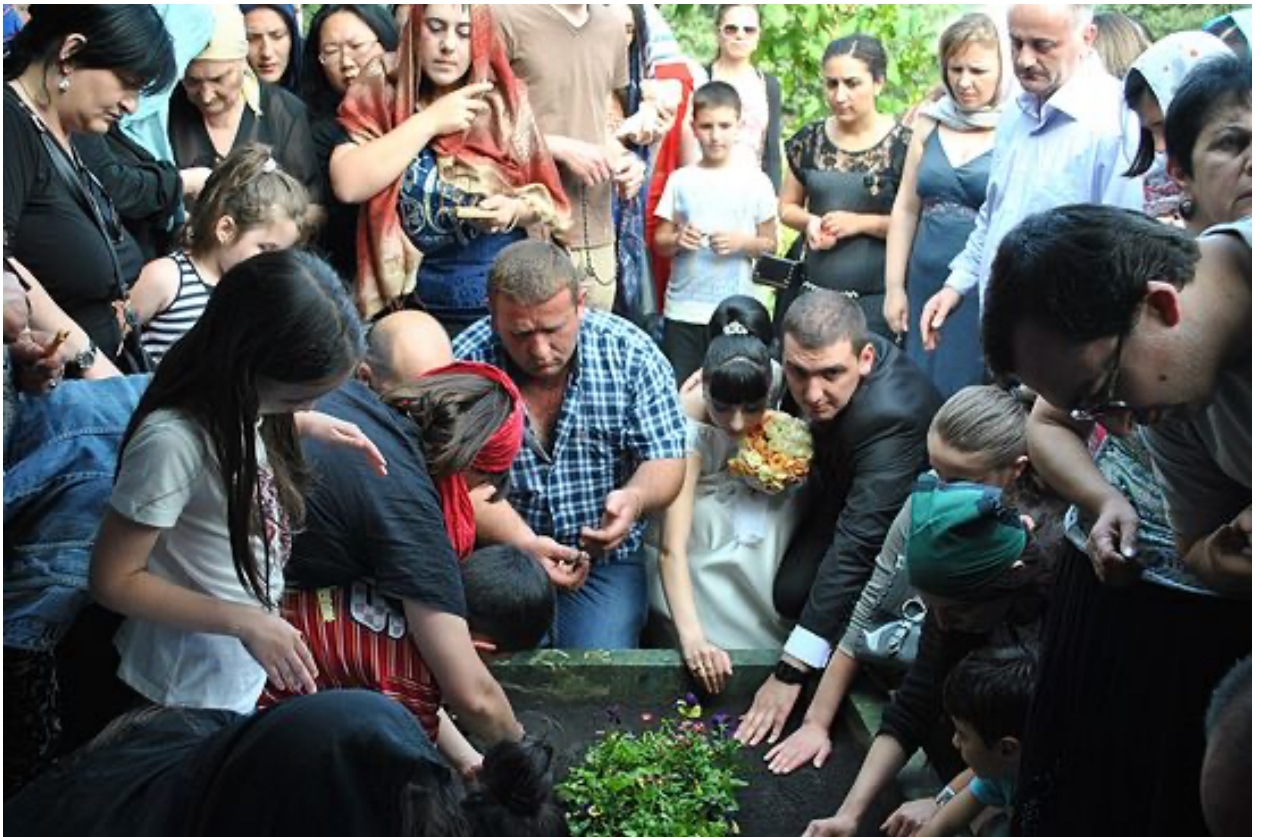
молодожёны берут благословение

Однажды в солнечный день народу на могилке было немного. Сидя в тени на лавочке под разросшимися лозами винограда, я читала Евангелие, Псалтирь, наблюдала за подходящими людьми.