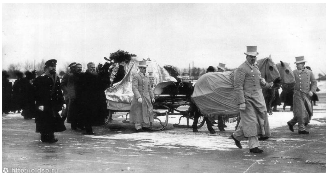
Через Финский залив.

Вдова Елизавета Константиновна пережила отца Иоанна всего на несколько месяцев, и была похоронена 24 мая 1909 года на кладбище у Андреевского собора (в конце жизни Елизавета Константиновна перенесла тяжелую операцию, после которой лишилась ног).