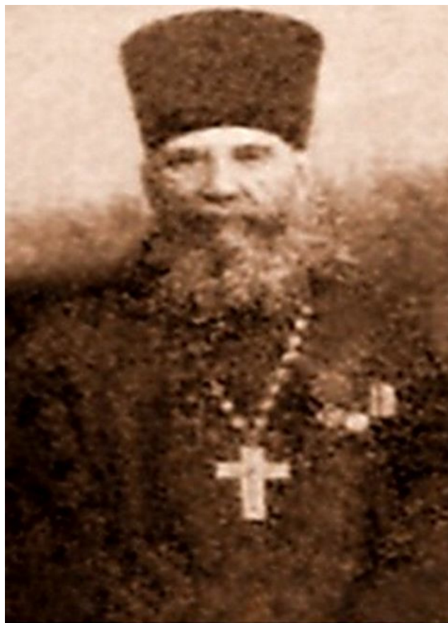
Сщ.мч. Александр Миропольский