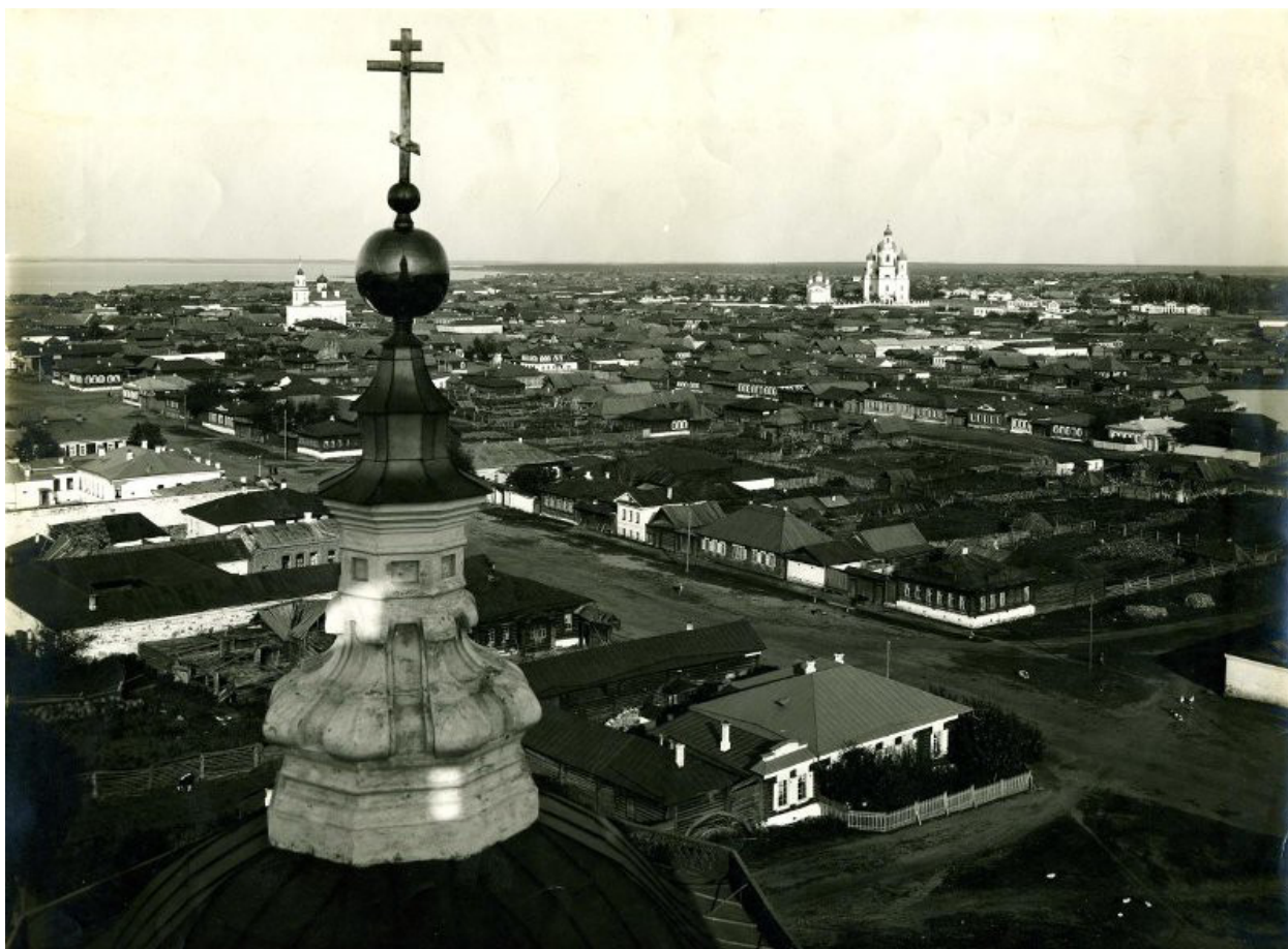
г. Касли, старинное фото